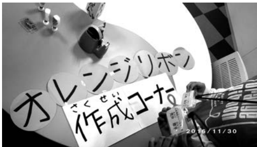
写真3 佐野市役所 市民活動スペース