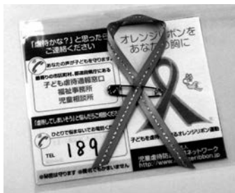
写真1 学生手作りのオレンジリボン

制度的な対応について充実が図られてきた。しかしながら、子どもの生命が奪われるなど重大な児童虐待事件が後を絶たず、全国の児童相談所における児童虐待に関する相談対応件数も先に述べたように増加を続け、依然として、社会全体で早急に取り組むべき重要な課題となっている。そのようなことに鑑み、2004（平成16）年から児童虐待防止法が施行された11月を「児童虐待防止推進月間」と位置づけ、児童虐待問題に対する社会的関