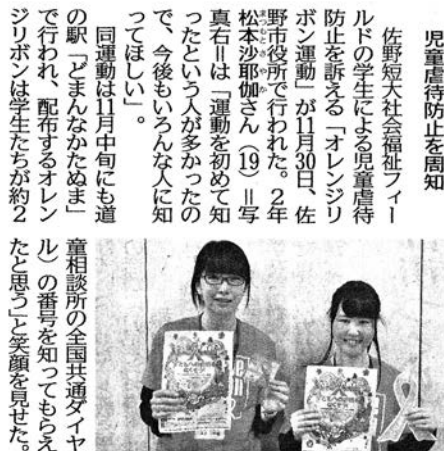
資料1 平成28年12月7日付 下野新聞