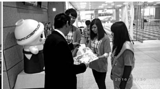
写真4 佐野市役所に配布の様子