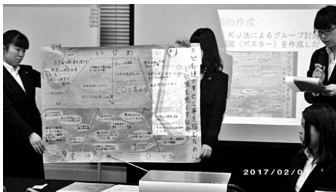
写真6 全国大会での発表の様子