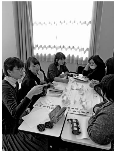
写真5 ブレインストーミング法によるグループ討議。特性要因図作成の様子。